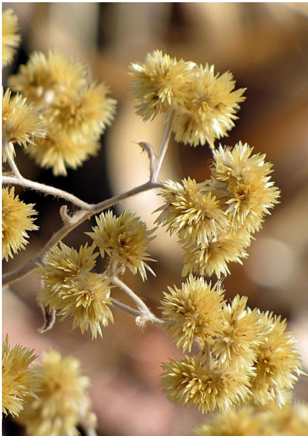
Macela; Marcela; Marcela-do-campo