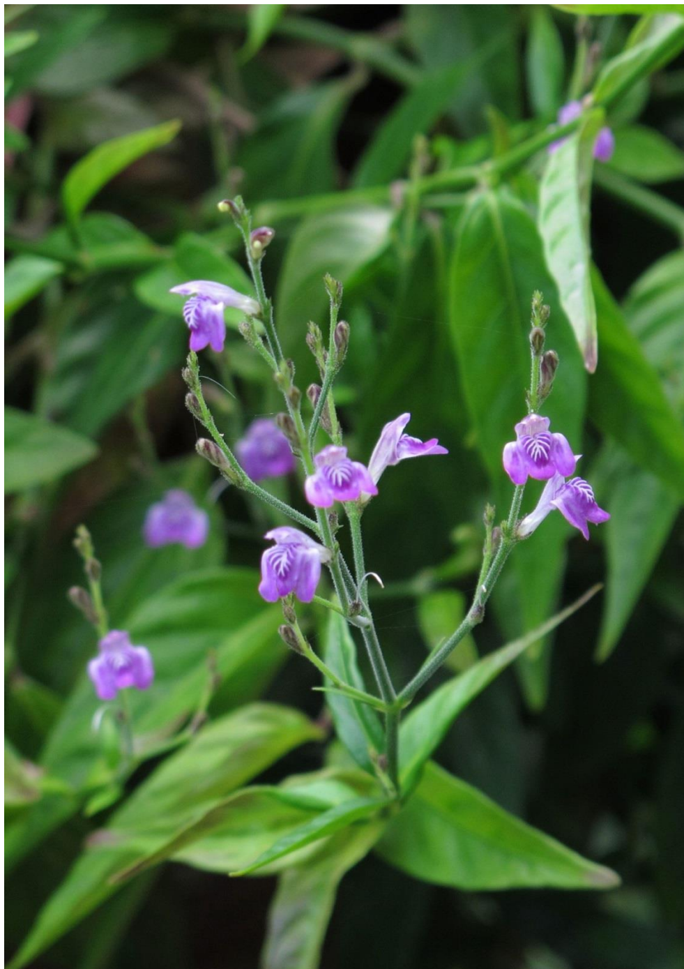
Chambá, Chachambá, Trevo-cumaru