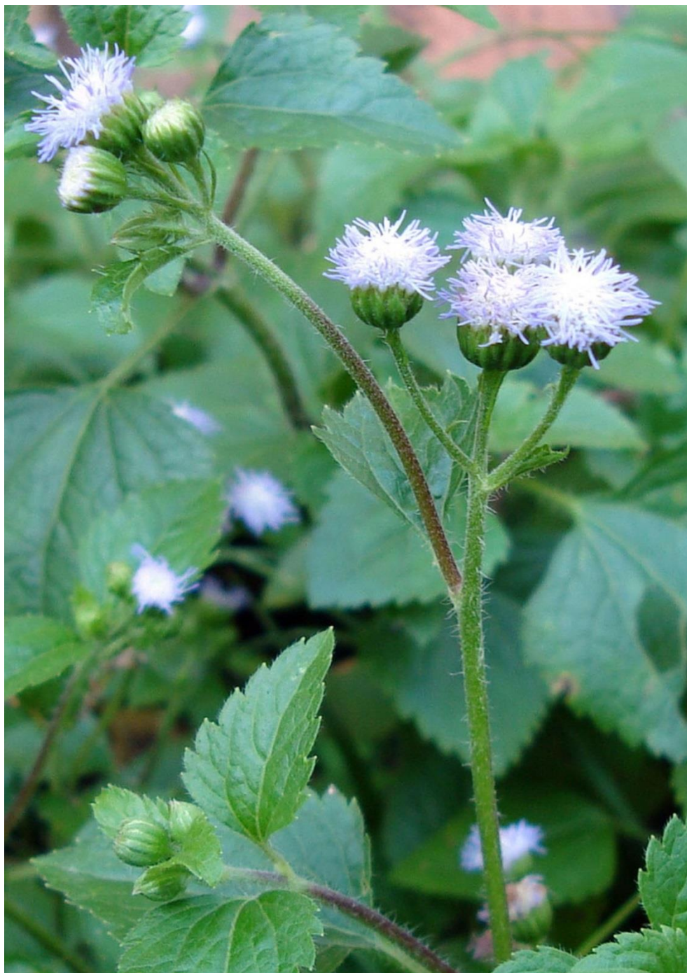
Mentras to, Catinga-de-bode