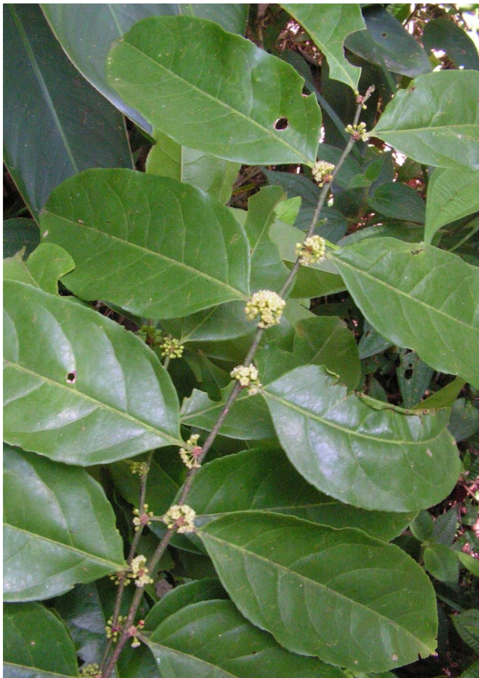
Guaçatonga, Erva-de-bugre, Erva-de-lagarto