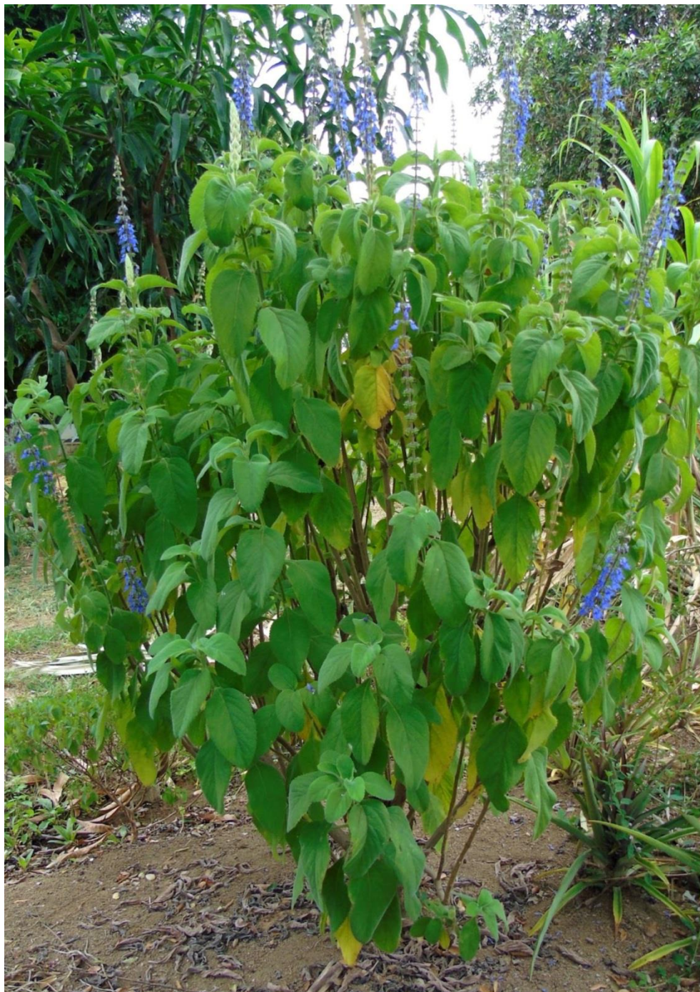
Boldo-nacional, Hortelã homem, falso-boldo