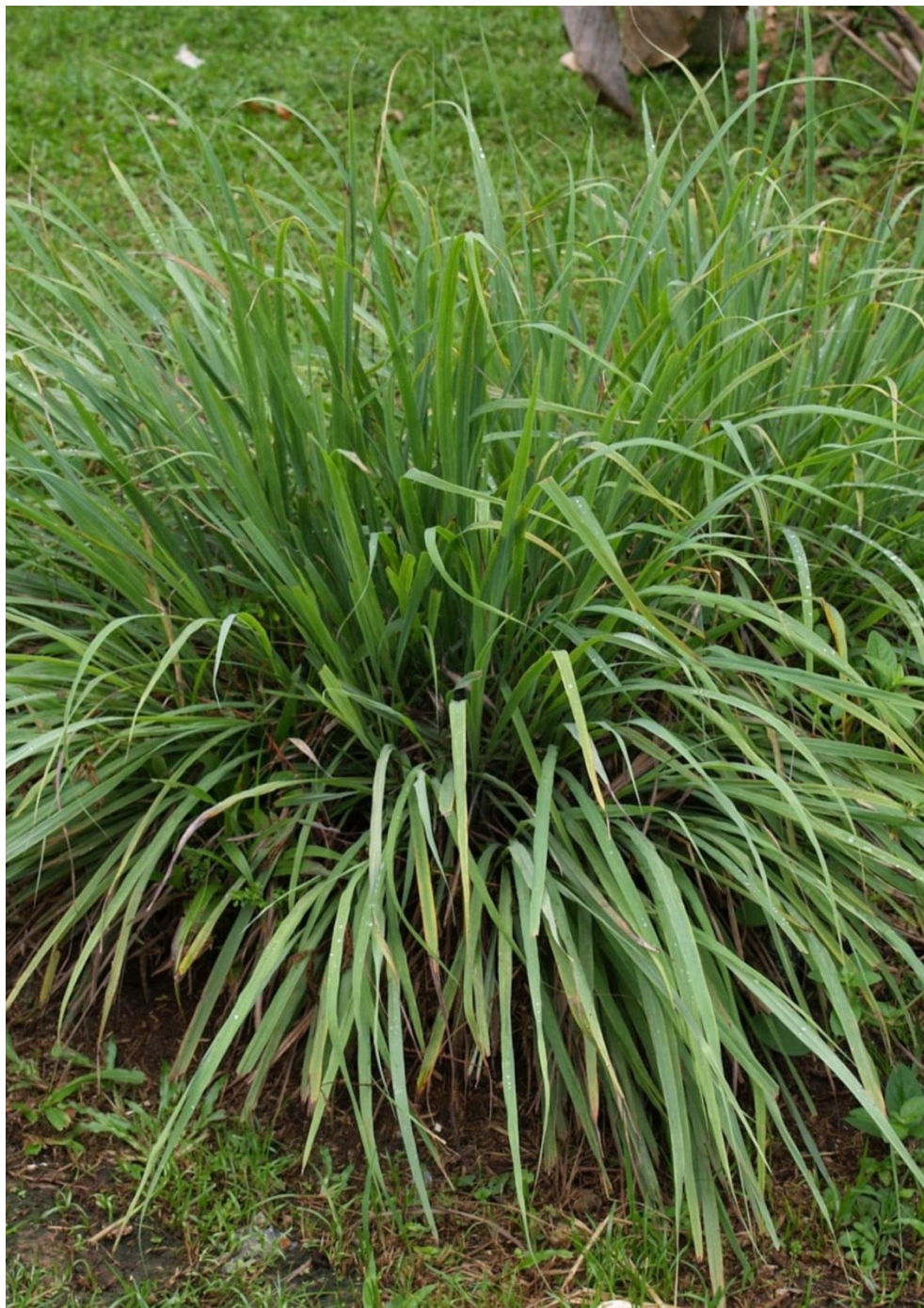
Capim-santo, Capim-limão, Capim-cidrô, Capim-cidreira, Cidreira.