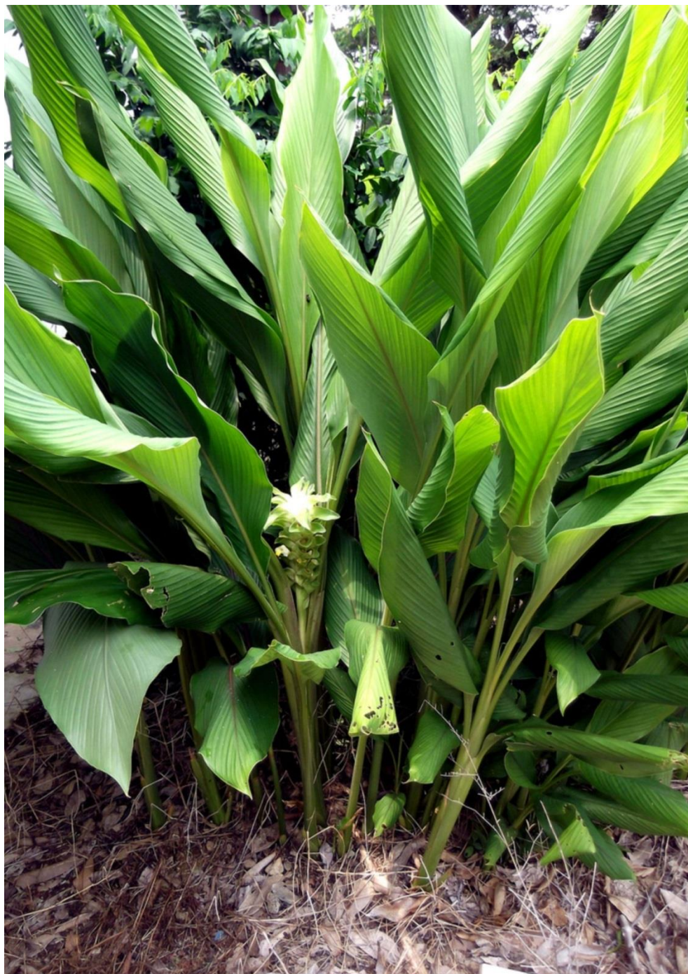
Curcuma, Zedoária, Açafroa, Açafrão-da-Terra