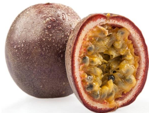
Fruto Passiflora edulis

Referências: DINIZ et al , 2006. GUPTA et al , 1995. MATOS et al , 2001. MATOS, 1997a. MATOS, 1997b. MATOS, 1998. MATOS, 2000. MELO-DINIZ et al , 1998. SIMÕES et al , 1998. VIANA et al , 1998.