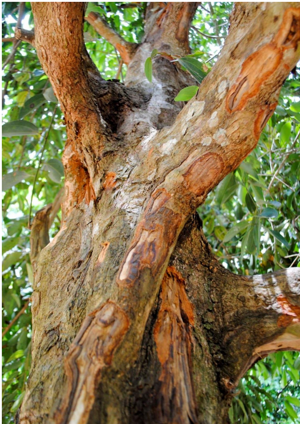
Canela, Canela-do-Ceilão e Canela-da-China