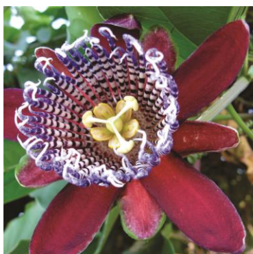
Flor Passiflora alata

Referências: DINIZ et al , 2006. GUPTA et al , 1995. MATOS et al , 2001. MATOS, 1997a. MATOS, 1997b. MATOS, 1998. MATOS, 2000. MELO-DINIZ et al , 1998. SIMÕES et al , 1998. VIANA et al , 1998.