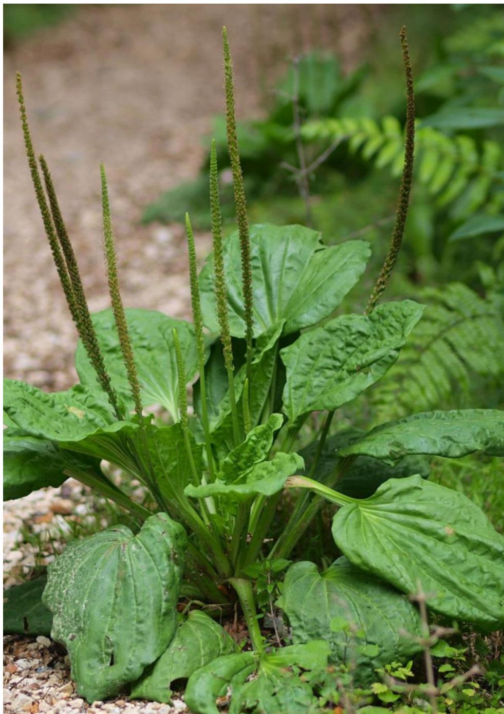
Tanchagem, Tansagem, Tranchagem